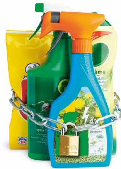
Waschmittel, Insektenspray, Dünger & Co. sind keine gute Gesellschaft für kleine Kinder.

Ihr Kind ist nun schon viel selbstständiger. Es lernt ständig dazu und ahmt die Erwachsenen nach. Treffen Sie die richtigen Massnahmen und seien Sie ein Vorbild.